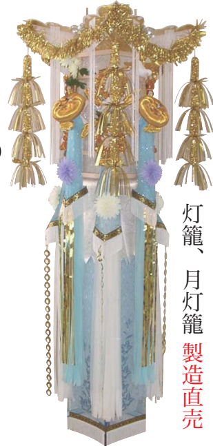
灯籠、月灯籠 製造直売

お盆というのはご先祖の霊を迎えるためのお祭りのことです。昔から日本ではお正月とお盆にはご先祖の霊がこの世に帰ってくると考えられていました。お盆には迎え火をたいてあの世に送るまでご先祖と一緒に暮らしているつもりで過ごすのです。ご先祖の霊は胡瓜で作った馬に乗り帰ります。そして、茄子で作った牛にお土産を載せてあの世に帰ります。お盆にはご先祖に捧げ物を並べる盆棚を準備し、素麺や水、野菜などをお供えます。